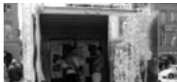
... be container