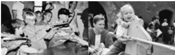
Kinder wurden zu Armbrustschützen wie dazumal Wilhelm Tell oder wagten sich aufs «Pferd» zum Lanzenduell

Dank der Zusammenarbeit mit andern Institutionen konnten Synergie- und Schneeballeffekte erzielt und nicht zuletzt auch Kosten gespart werden.