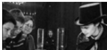
gezaubert oder ...