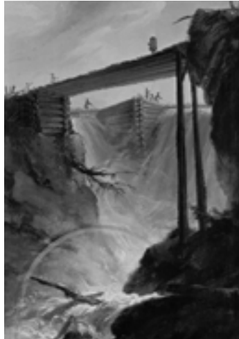
Das Wehr bei Mühletal. 1776

Der Bericht kann kostenlos bezogen werden bei: Kathrin Pieren, SAGW, Hirschengraben 11, Postfach, 3001 Bern, Tel. 141 31 311 33 76, Fax 141 31 311 91 64, E-Mail pieren@sagw.unibe.ch