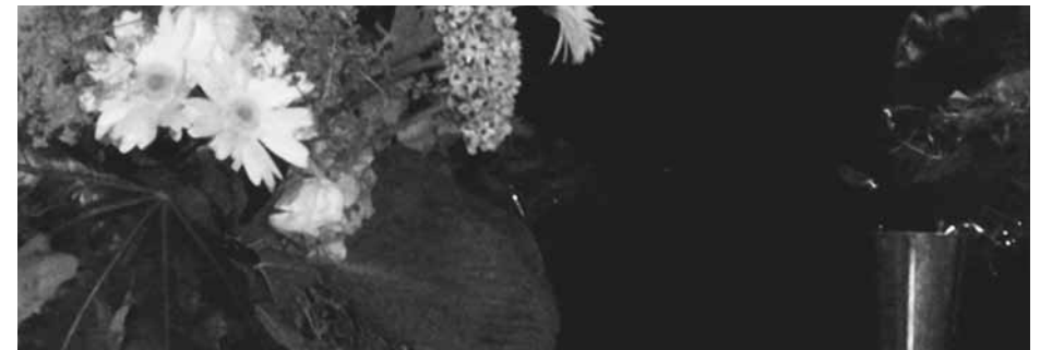
Un bouquet de fleurs pour notre nouvelle présidente.