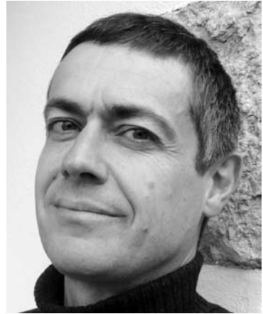
Martin Wyss ist der Präsident der Schweizerischen Gesellschaft für Gesetzgebung. Die SGG ist das jüngste Mitglied der SAGW.

Die wissenschaftlichen Jahrestagungen der SGG (2008: Gesetzgebung im Polizeirecht; 2007: Materielle und formelle Überprüfung der Gesetzgebung; 2006: Private Normen und staatliche Rechtsetzung; 2005: Die Gesetzgebung und die Zeit) sind ganz bewusst darauf ausgerichtet, Forschung und Anwendung, Theorie und Praxis der Gesetzgebung zusammenzuführen. Einen engen Kontakt pflegt die SGG mit Partnerinstitutionen im Ausland und mit der Europäischen Vereinigung für Gesetzgebung (European Association of Legislation – EAL, die sich 2008 zur «International Association of Legislation» umbenannt hat), der heute mit Luzius Maeder ein ehemaliger Präsident der SGG vor-