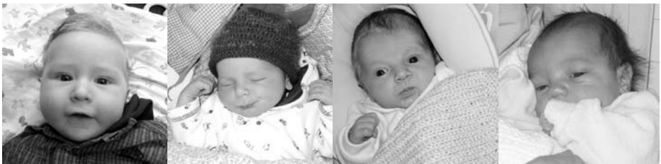
Emanuel, 11. Mai

Im 2008 hat sich das SAGW-Team voll für das Netzwerk Generationenbeziehungen eingesetzt. Das Ergebnis hat Hand und Fuss: